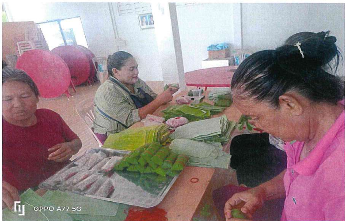
แผนกผลิต 3 คน